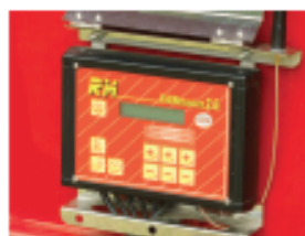
Komputer Rainmaster 2.6