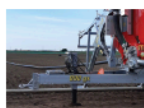
Hydrauliczna stopa podporowa